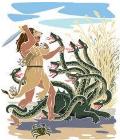
Ο Ηρακλής σκοτώνει τη Λερναία Ύδρα

16. Να μεταφέρεις την πιο κάτω πρόταση στην αντίθετη φωνή. (3) Ο Ηρακλής είχε πνίξει τα φίδια και σκότωσε τη Λερναία Ύδρα.